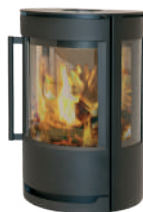
WIKING Luma 1