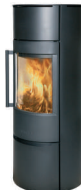
WIKING Luma 6