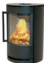
WIKING Luma 2