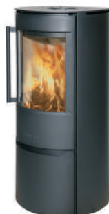
WIKING Luma 4