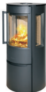
WIKING Luma 3