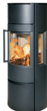
WIKING Luma 5